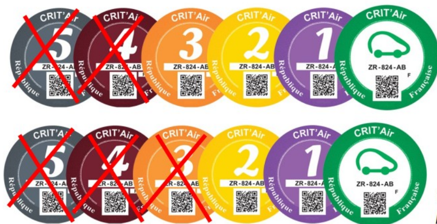
Vignettes Crit'Air autorisées pour les véhicules légers

A compter de demain, jeudi 21 juillet 2022, de 6h00 à 20h00, la circulation des véhicules légers, y compris les deux roues, de classe 4, 5 et non classés ainsi que des poids-lourds de classe 3, 4, 5 et non classés est interdite par arrêté dans le périmètre du bassin de vie d'Avignon, soit 16 communes de Vaucluse et du Gard (communes du Grand Avignon).