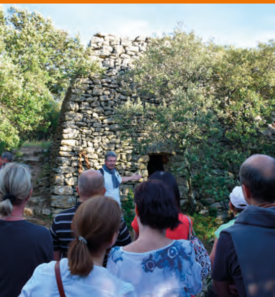
Découverte des cabanes en pierre sèche, Le Beaucet.

👁 Les grands rendez-vous nationaux D'UN COUP D'ŒIL !