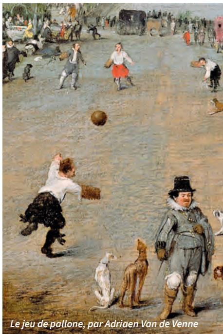
Le jeu de pallone, par Adriaen Van de Venne