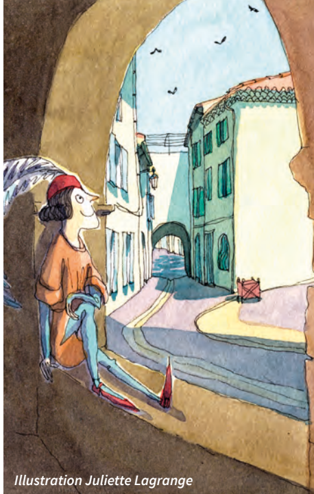
Illustration Juliette Lagrange