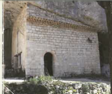
La Chapelle Saint-Michel

Édifice modeste datant du XII e siècle, la chapelle se compose d'une courte nef rectangulaire et d'une abside semi-circulaire voûtée en cul de four. Sur le mur apparaissent les traces d'une taille décorative spécifique de l'époque romane. La chapelle a été restaurée en 1643 (inscription gravée sur la porte). À l'ouest se trouvait un ermitage où vécut quelques ermites aux XVIII e et XIX e siècles. Au dessus de cet édifice se trouvent deux abris sous-roche occupés à l'époque préhistorique.